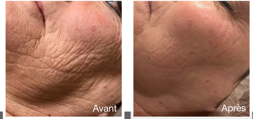
Amélioration de l'ovale du visage après 4 traitements