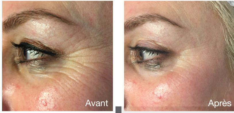
Amélioration du contour des yeux après un traitement