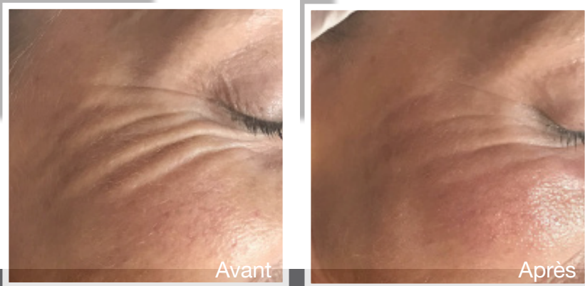
Amélioration du contour des yeux après un traitement